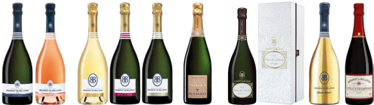
商品名 年代 容量 (ml) 種類 入数 参考小売価格 備考 / POS